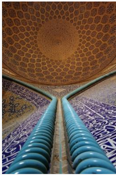
طرح روی جلد: مسجد شیخ طایف‌الله (اصفهان)