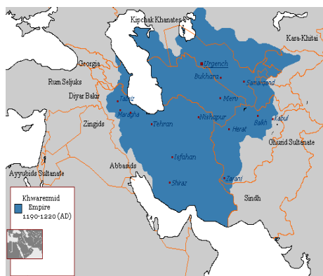
نقشه ایران در زمان پادشاهی سلطان محمد خوارزمشاه

چنگیزخان مقدم این گروه ایرانی را گرمی داشته و از آن‌ها پذیرایی کرده و نیز توسط ایشان پیغام داد که مایل به دوستی دو جانبه بوده و خواستار روابط بازرگانی بین دو کشور می‌باشد و درخواست نمود که در صورت موافقت، بازرگانان ایرانی و مغولی بین دو کشور رفت و آمد کنند. از آنجا که دو کشور خوارزم و چنگیز مجاور یکدیگر بودند بازرگانان خوارزم به مغولستان رفتند و چنگیزخان نیز کارهای آن‌ها را به بهای خوبی خریداری کرده و سپس گروهی از بازرگانان خود را به خوارزم فرستاد. دو کشور تعهد کردند که در همسایگی یکدیگر بصورت دوست باقی بمانند و روابط تجاری داشته باشند.