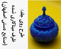
طرح روی جلد: طرف میثاقاری شده (صنایع دستی اصفهان)