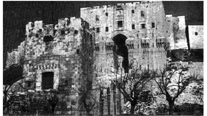
تصویر ۳ - زندان سهروردی در حلب (سوریه)

در سلسله انوار هر نور زیرینی نسبت به نور برین خود شوق و عشق ذاتی دارد، و هر نور بالاتر نسبت به انوار زیرین رابطه قهری دارد. و تمام موجودات و کل هستی در تکاپو برای یکی شدن با مصدر خویش یعنی نورالانوار هستند.